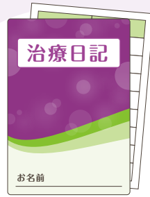
治療日記／体調チェック表