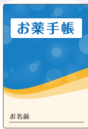
検査データのコピーや お薬手帳

医療機関に影響するほどの大規模災害時には、医療機関や治療法を変更しなくてはならない状況も考えられます。ご自身の治療歴や病状を伝えられるものをいつでも活用できるようにしておきましょう。